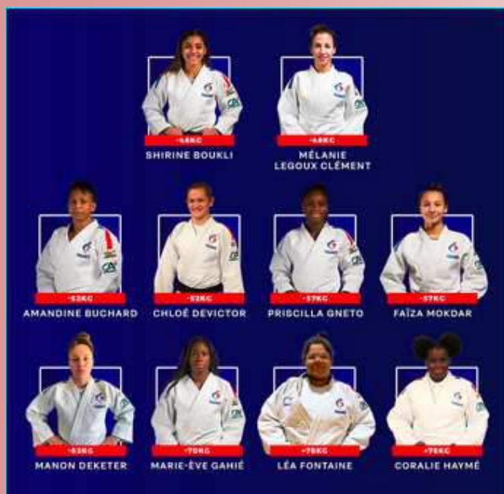
La sélection féminine

La dernière épreuve de la saison des Grands Slams s'est ouverte ce vendredi 26 novembre aux Emirats arabes unis sur les tatamis de la Jiu-Jitsu Arena d'Abu Dhabi. L'équipe de France a plutôt fait bonne figure en remportant un total de 9 médailles dont une en or .