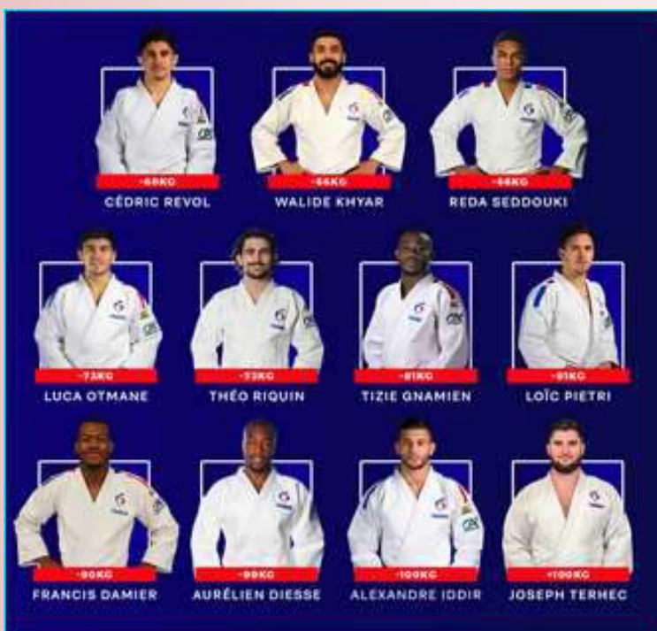
La sélection masculine

Pour le compte de la première journée de compétition, Amandine Buchard s'est emparée de l'or tandis que Shirine Boukli et Priscilla Gneto décrochaient respectivement l'argent. La journée se terminait avec le bronze pour Mélanie Legoux-Clément , Faiza Mokdar et Cédric Revol .